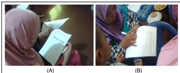
Gambar 4. Peserta mengisi kuisioner evaluasi (A) dan uji organoleptik pada edible film (B).