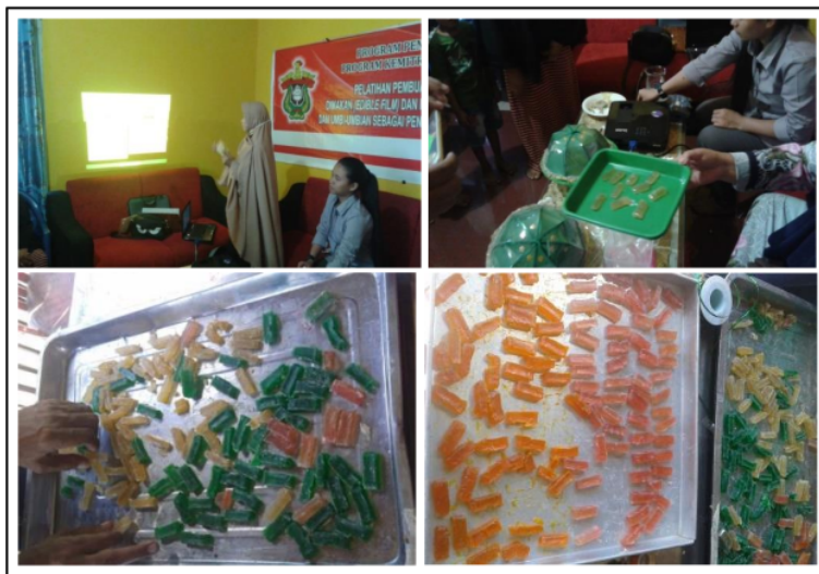
Gambar 3. Materi pembuatan dan aplikasi edible film dengan melibatkan peserta

keterampilan masyarakat dalam membuat edible film . Pelatihan diberikan selama sehari. Metode pelatihan efektif yang diterapkan adalah tanya jawab dan pemberian contoh aplikasi pada pangan olahan basah seperti dodol. Peserta adalah ibu-ibu kelompok tani dan nelayan sebanyak 15 orang sebagai kader.